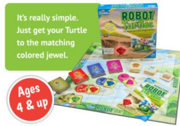
Robot Teknősök társasjáték 17

Az elemmel működő játékok között számos programozható játékot találunk, amelyeket kártyák helyett gombokkal, színes kockákkal, színes vonalakkal lehet vezélni, így fejlesztik a programozási készségeket.